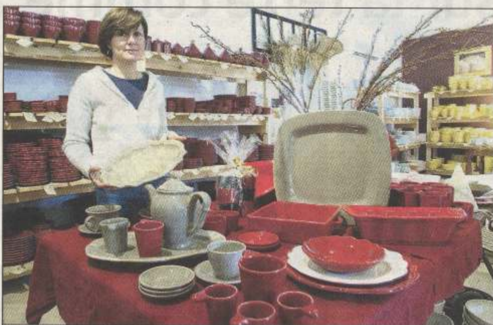
Une avalanche de formes et de couleurs... à prix d'usine!

Dans de grands entrepôts sont exposés, à perte de vue, des services de table. De la couleur pimpante, du blanc classique, mais toujours cette solide faïence calcique émaillée qui fait les belles tables du quotidien. Si vous croyez reconnaître des services croisés ça et