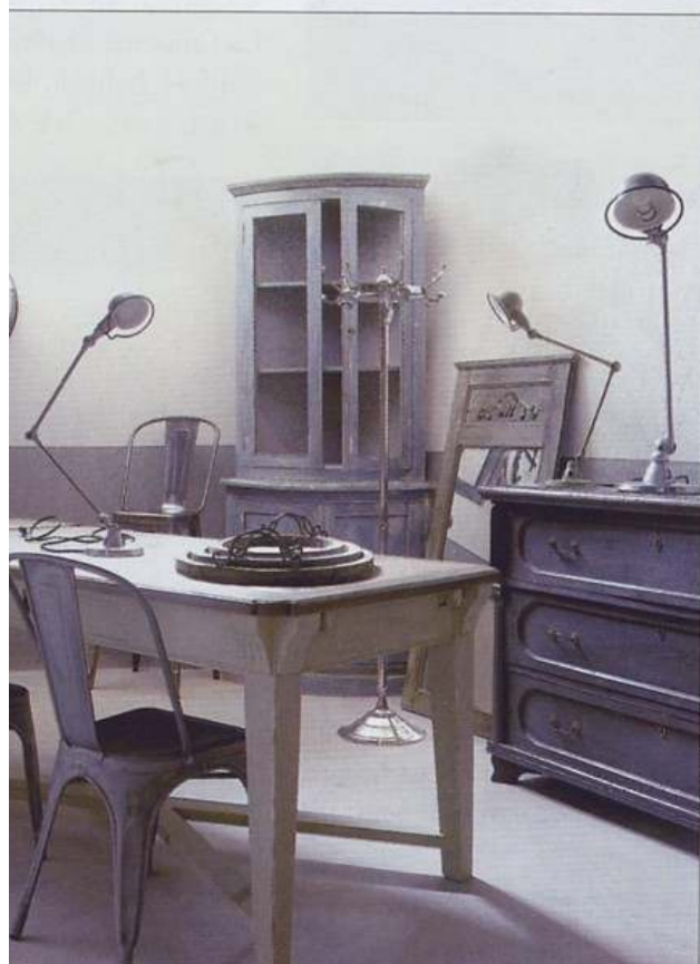
H. DEL OLMO

présentation claire, étagères brutes badigeonnées de blanc. Le plus tentant ? les collections aux lignes traditionnelles revisitées ou nettement contemporaines d'une région qui fait toujours rêver : la Provence. Le plus craquant ? la palette de couleurs, qui passe du blanc pur au brun taupe, en déclinant les teintes vives ou pastel : le prune et le lilas, l'orange et le fuchsia. Le plus pratique ? la résistance des pièces au lave-vaisselle. Le plus amusant ? des assiettes cassées, 2€ le carton, avis aux bricoleurs doués pour la mosaïque ! Pour parachever son concept, la marque, qui n'a jamais cessé de mouler, cuire et émailler depuis le XVII e siècle, propose premier choix, fins de séries et articles déclassés à des prix défiant toute concurrence : 2€ et 4€ l'assiette ! Magasin Usine Varages, 3, rue Théron-Montaugé, CC Gramont, 31200, tél. : 05 34 30 94 14, site : varages.com Ouvert 7 jours sur 7, de 9 h à 18 h. G.D.